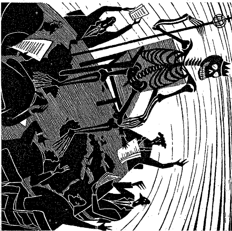
ILLUSTRATION: GABI KOPF

Das Ergebnis soll dann als Rüstfuss in den politischen Prozess eingepreist